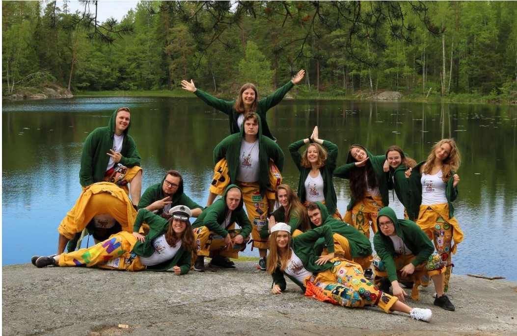
KOMPIS 19 under KOMPIS-veckan på Briggen