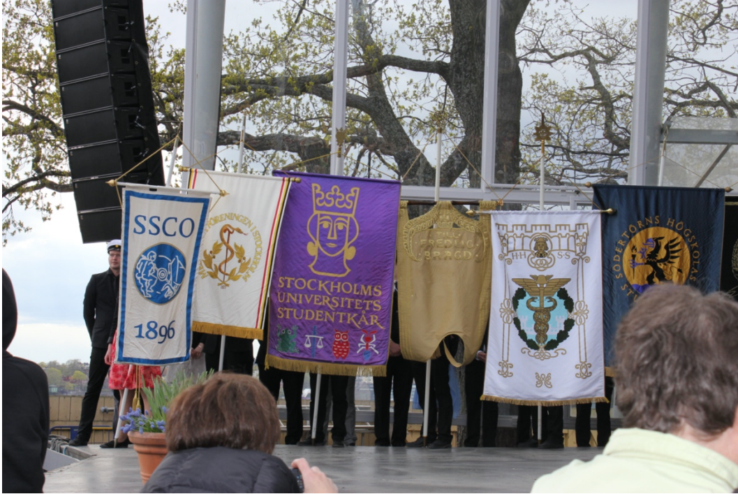
Bild 1: Foto från Valborg på Skansen där THS Fanborg medverkar tillsammans med SSCO och standar från olika skolor representeras. Det guldiga standaret med texten "Till Fredlig Bragd" är THS standar.