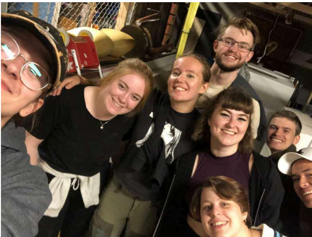
Dekorgruppen + bärhjälp som äntligen är färdiga med dekisflytten!

Förutom det logistiska helvetet är den nya lokalen en enorm nedgradering från gamla Dekis. Nya Dekis är markant mycket mindre än den gamla lokalen (ungefär 1/10 effektiv volym), situerad vägg till vägg med ett "jättekänsligt laserlabb" (lmao) och vi får inte måla kulisser eller rekvisita inuti lokalen, det måste göras utanför (även under vintern!). På grund av flytten var det inte möjligt för dekorgruppen att börja sin verksamhet förens en månad innan föreställningarna. Trots detta gjorde dekorgruppen ett arbete som hade varit imponerande även med ett helt verksamhetsår och den gamla lokalen.