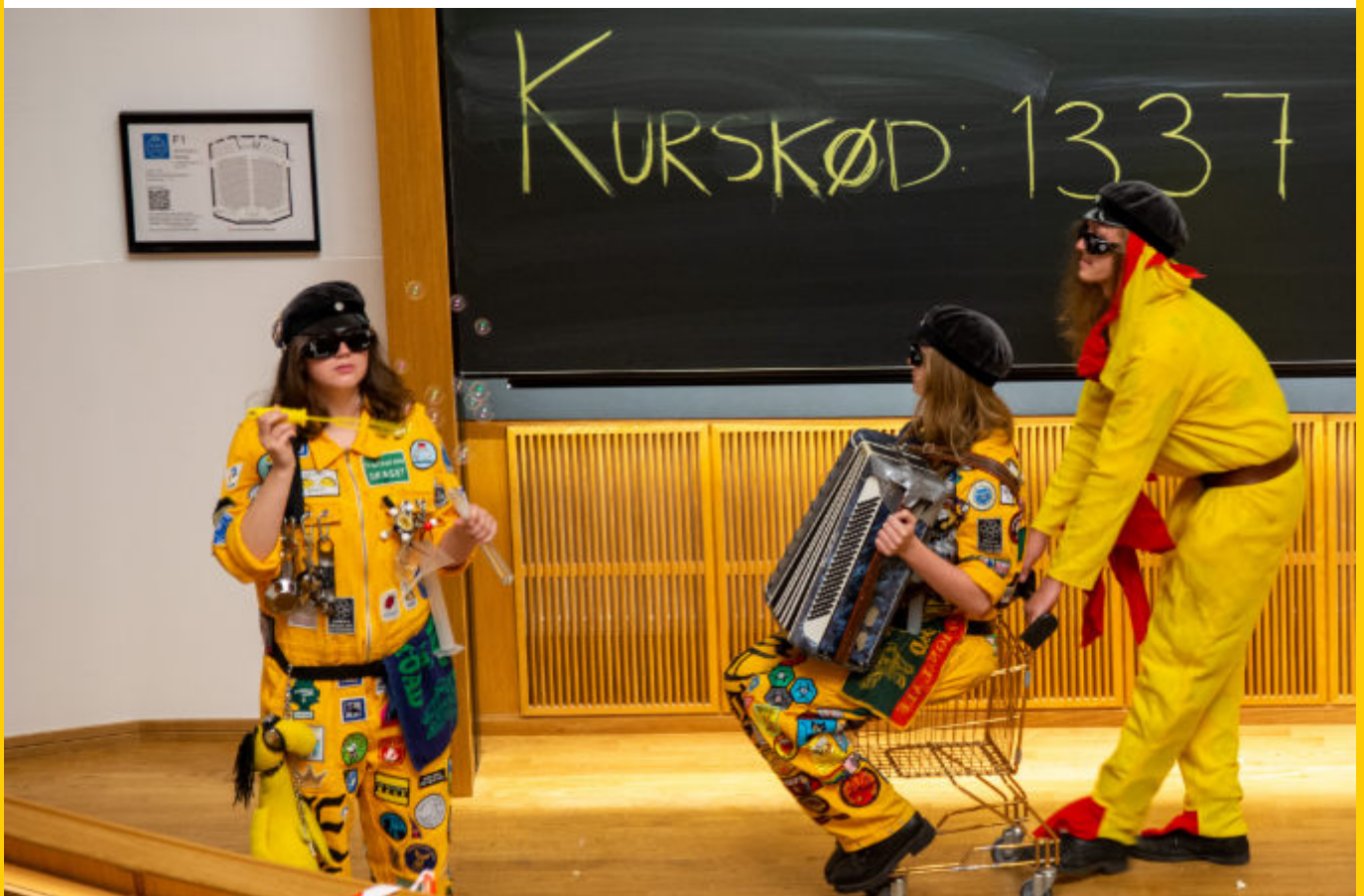
Såpbubblor, dragspel och kycklingdräkt var några av pHeuseriets sätt att hjälpa nØllan fokusera på tentan.