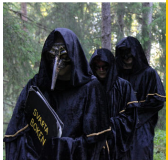
Under kåporna bär Alkemisterna masker.

– Alla mottagare och KLUMP har varit superhjälsamma och hela tiden så positiva, trots att saker ändrats och det inte blir som man tänkt, säger Sofie. →