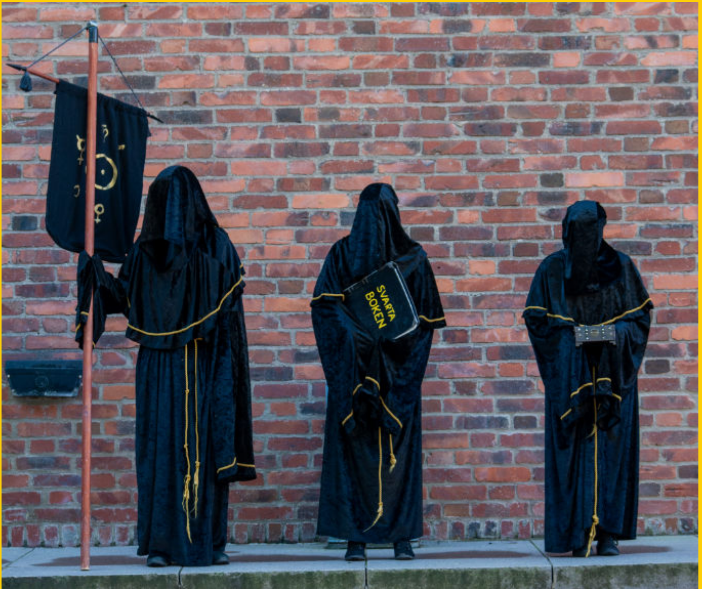
Alkemisterna vakar över nØllan vid Kemigården.