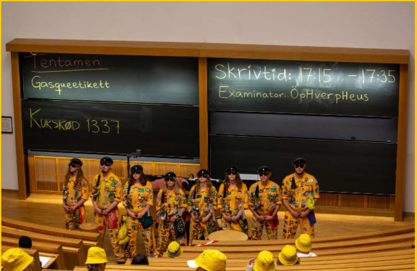
pHeuseriet höll tentamen i gasqueetikett för nØllan.