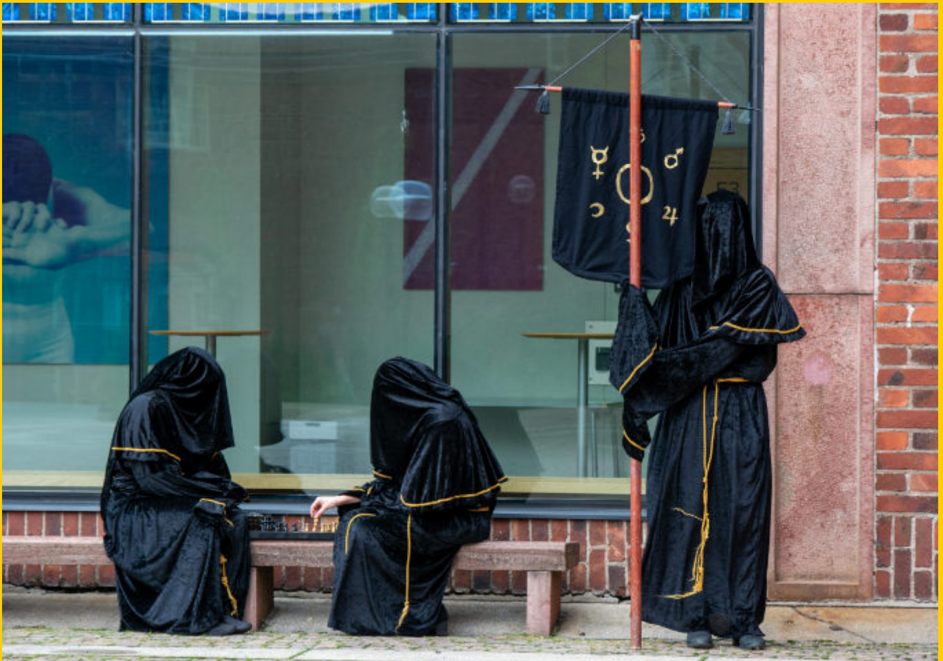
Under vecka 2 spelade Alkemisterna schack i ösregnet.

→ – Och om det blev problem för ett organ hjälpte alla andra organ till med att lösa det, säger Elin.