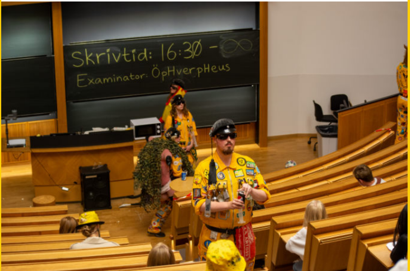
pHeuseriet var generösa med skrivtiden på gasqueetikettentan, som hölls i två omgångar.