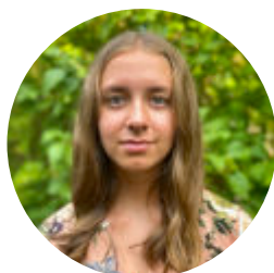
Alexandra Andersson Text och grafisk design