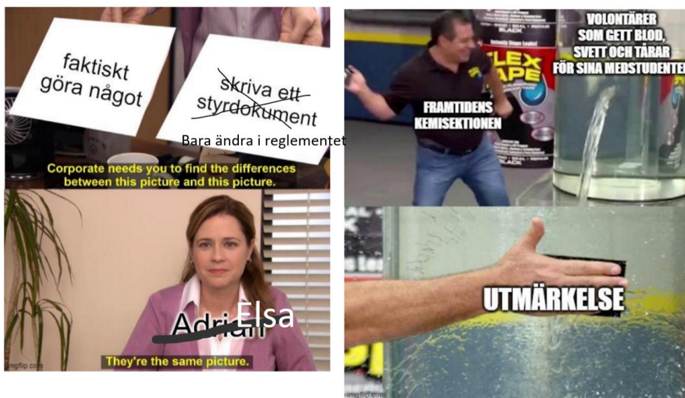
Figur 1: Parafraas på Adrians memes.